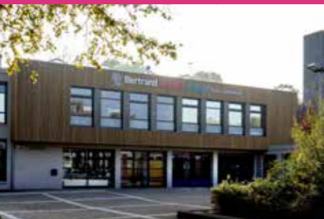
Bertrand Russell College Onderbouw Erasmusstraat 1 Krommenie